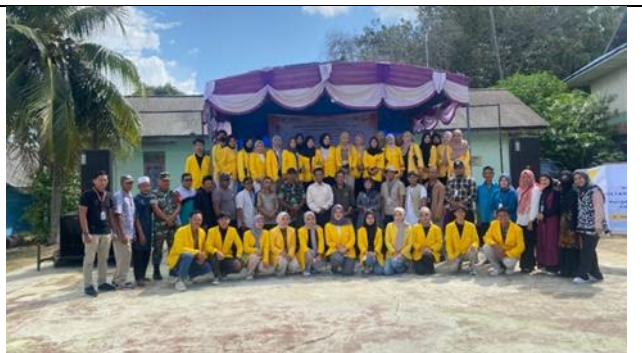
Gambar 2 Acara pembukaan pengabdian kepada masyarakat di lapangan Kantor Desa Penarah

Bagi pemerintah desa penarah akan membantu pemerintah dalam mensejahterakan Masyarakat baik untuk penghasilan harian ataupun kebutuhan sehari-hari. Bagi Masyarakat akan mendapatkan pengetahuan dan pemahaman tentang regulasi kebijakan pada ketahanan pangan terutama potensi lokal yang di Desa Penarah yaitu Karbohidrat Sagu dan lainnya untuk kehidupan sehari-hari. Sedangkan dampak positif yang diharapkan dari pelaksanaan program pengabdian kepada Masyarakat, antara lain: Memasyarakatkan dan mensosialisasikan keunggulan dan sumber daya alam dan sumber daya manusia daerahnya. Meningkatnya kesadaran Masyarakat akan pentingnya pemanfaatan potensi lokal yaitu dari pertanian, ikan dan karbohidrat agar tidak terjadinya stunting pada Balita, karena stunting yang sedang booming pada saat ini. Sebagai bukti dari respon baik tersebut, warga sekitar pun bergerak untuk memberikan materi dalam bentuk makanan dan konsumsi lainnya.