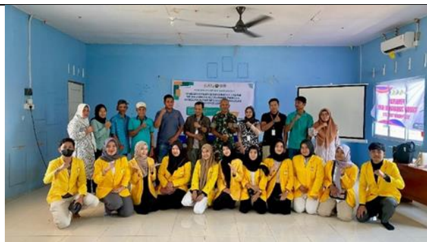
Gambar 3 Kegiatan Sosialisasi dari Bidang Akademisi dan Militer