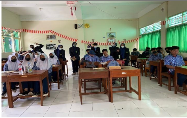
Gambar 2. Pemaparan materi dan pre test mengenai pentingnya mengenal kesetaraan gender