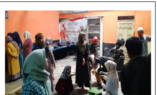
Gambar 5. Praktek pengolahan bambu candani

Setelah diberikan penjelasan oleh praktisi bambu candani dan Ketua LMDH Argo Mulyo, kemudian dilanjutkan dengan praktek ketrampilan pengolahan dan pengeringan bambu candani. Praktek ketrampilan dapat dilakukan apabila tersedia mesin serta peralatan yang terkait dengan pengolahan dan pengeringan bambu candani. Tujuan dari penggunaan mesin adalah untuk meningkatkan kualitas hasil produksi bambu candani yang selama ini dilakukan secara manual. Dengan menggunakan mesin maka waktu yang ada menjadi lebih efektif dan efisien. Di sisi lain kualitas dari bambu yang diproses dengan menggunakan mesin menjadi lebih berkualitas baik bentuk maupun tampilan bambu candani tersebut. Di bawah ini ditampilkan gambar-gambar yang menunjukkan aktivitas pelatihan ketrampilan tersebut.