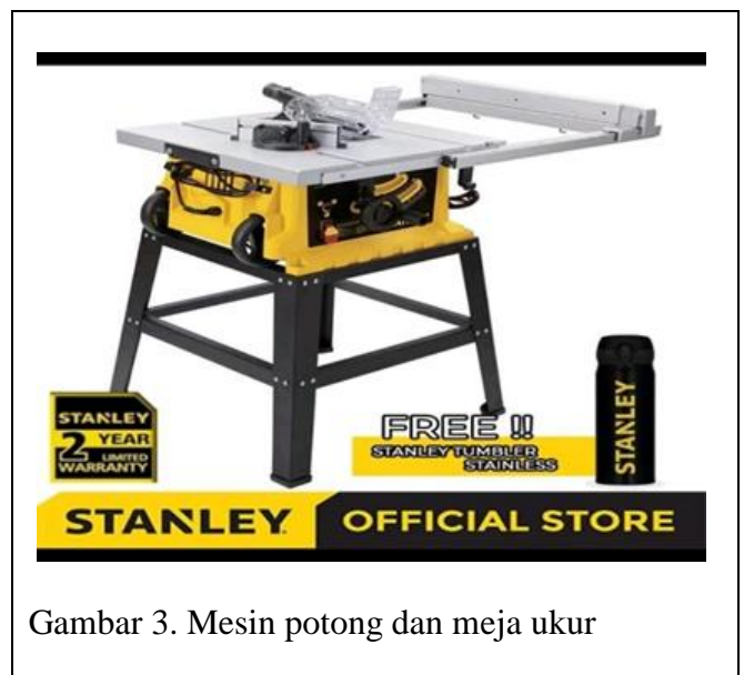
Gambar 3. Mesin potong dan meja ukur

kelembagaan. Kelembagaan merupakan salah aspek penting dalam pemberdayaan anggota LMDH Argo Mulyo. Aspek lain yang menjadi perhatian adalah pentingnya ketrampilan anggota LMDH dalam penggunaan alat pengolah dan pengering Bambu Cendani sehingga kualitas Bambu Cendani menjadi optimal untuk dipasarkan. Ketrampilan yang diperoleh anggota LMDH Argo Mulyo tersebut perlu didukung dengan ketersediaan mesin pengolah dan pengering Bambu Cendani karena semakin lengkap mesin pengolah dan pengering Bambu Cendani yang dimiliki LMDH Argo Mulyo dan didukung dengan ketrampilan dalam penggunaan mesin pengolah dan pengering Bambu Cendani tersebut dapat menghasilkan Bambu Cendani yang berkualitas.