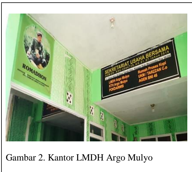
Gambar 2. Kantor LMDH Argo Mulyo

Kegiatan pengabdian kepada masyarakat diawali dengan kunjungan atau survey awal pada bulan Juni 2023. Survey dilakukan untuk memastikan pelaksanaan kegiatan pengabdian masyarakat berjalan lancar dan efektif. Kegiatan survey dilakukan dengan cara menemui Ketua LMDH Argo Mulyo dan staf produksi bambu cendani untuk melakukan diskusi secara intensif sehingga pelaksanaan pelatihan ketrampilan penggunaan mesin pengolah dan pengering bambu cendani dapat berjalan lancar.