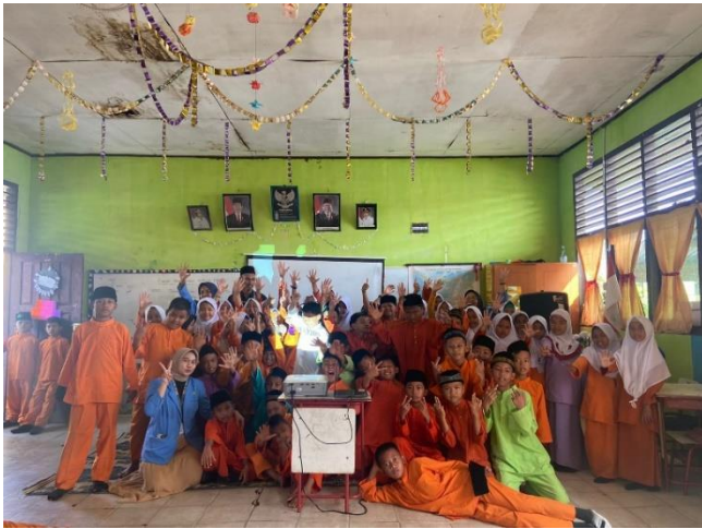
Gambar 4. Dokumentasi kegiatan setelah sosialisasi terlaksana

Pendidikan sekolah dasar menjadi pondasi dalam perkembangan kepribadian anak (Maria, 2017). Sehingga, pemahaman tentang bullying pada anak sekolah dasar menjadi penting dalam menjaga generasi bangsa. Kegiatan pertama hingga ketiga dapat terlaksana dengan baik. Seluruh siswa dapat memahami maksud dari bullying juga contoh-contoh kegiatan bullying dalam kehidupan sehari-hari. Evaluasi melalui kegiatan ini dilakukan dengan mengamati dan menanyakan kembali terhadap siswa/i terkait bersikap dan berinteraksi terhadap teman kelasnya.