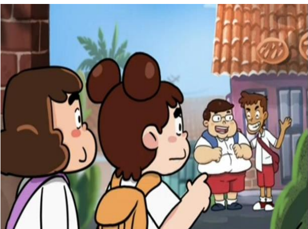
Gambar 2. Visualisasi animasi bullying melalui video.

Setelah siswa/i dikenalkan tentang bullying maka selanjutnya ditunjukkan video-video bullying dan dampaknya pada korban bullying . Kegiatan ini akan memperlihatkan visualisasi bullying dan dampaknya pada korban yang meningkatkan kesadaran bertindak dan sifat empati siswa (Salau et al., 2023)