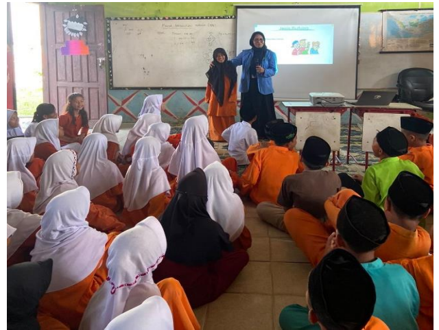
Gambar 3. Terjadinya dialog interaktif antara pemateri dengan para siswa/i

dengan orang lain terutama dalam benda. Pada kegiatan ini terjadi dialog interaktif antara pemateri dan pendengar mengidentifikasi perilaku yang tergolong dalam kategori bullying . Kegiatan ini diakhiri dengan bersalam-salaman saling memperkuatkan pertemanan antar siswa/i.