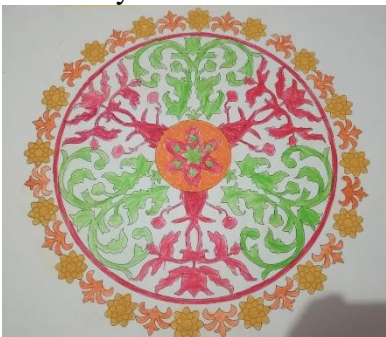
Gambar 4 Mewarnai Serumpun Bunga Taman Merupakan Karya Dari Vivianti Usia 10 Tahun Kelas 5 SD