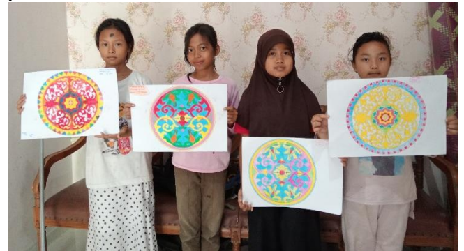
Gambar 9. Hasil Akhir Mewarnai

yang cerah seperti merah, kuning, biru, hijau dan pink.