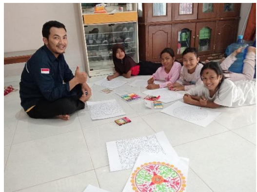
Gambar 7. Proses Awal Mewarnai

Dari ke 4 tahapan ini menghabiskan waktu mewarnai 1,5 jam.