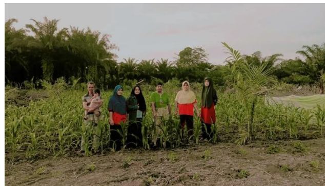
Gambar 1. Lahan dan anggota Kelompok tani Jaya bersama anggota pengabdian saat survei lokasi

Selain permasalahan utama tersebut ada juga permasalahan lain yaitu belum adanya kemasan yang baik untuk penjualan jagung hasil produksi, buah jagung langsung dijual setelah panen kepada masyarakat dan belum adanya pengolahan hasil produksi untuk produk jadi.