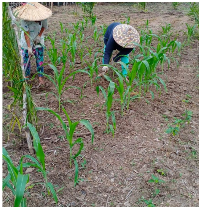
Gambar 2. Anggota kelompok tani yang berkerja menggunakan cangkul dan tajak / cangkul kecil