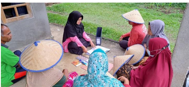
Gambar 4. Penyuluhan terkait pembuatan pembukuan / administrasi yang baik dan pemberian alat alat administrasi di Kelompok Tani.

Pengabdian masyarakat diadakan dua sesi yaitu pemberian penyuluhan dan pemberian alat alat administrasi Kelompok Tani Munsalo Kopah. Sesi pertama penyuluhan bertema tentang pencatatan tata kelola administrasi dalam pelaksanaan kegiatan Kelompok Tani Jaya. Sesi Kedua adalah penyerahan buku buku administrasi dan tudung kepada kelompok tadi di akhiri dengan acara makan bersama bersama kelompok tani Jaya.