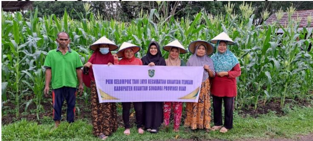
Gambar 3 Foto bersama setelah melakukan penyuluhan

Kegiatan ini dilaksanakan langsung di kebun jagung milik kelompok tani untuk sekaligus melihat beberapa kegiatan yang dilakukan oleh kelompok tani Jaya. Jumlah Kelompok Tani yang hadir pada kesempatan untuk mewakili kelompok tani Jaya berjumlah 6 orang dari 15 orang karena kesibukan anggota yang lainnya untuk berkerja ditempat lain.