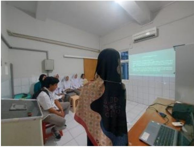
Gambar 3 Penyampaian Materi Oleh Tim Pengabdian