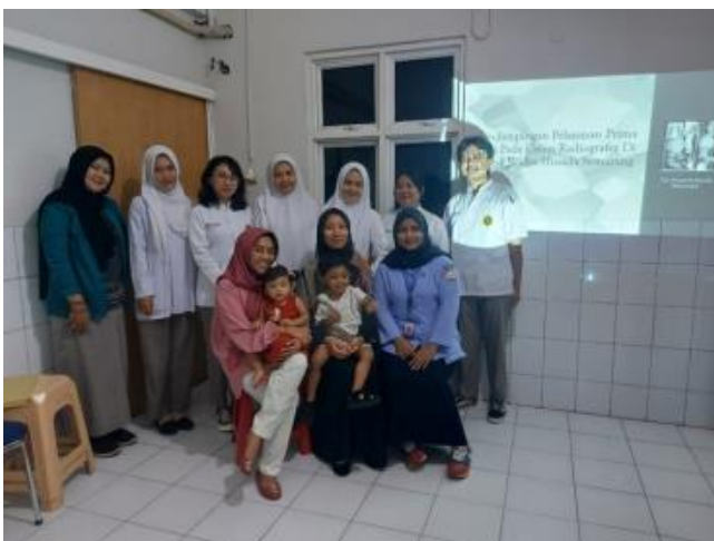
Gambar 5 Peserta Kegiatan Pengabdian Kepada Masyarakat