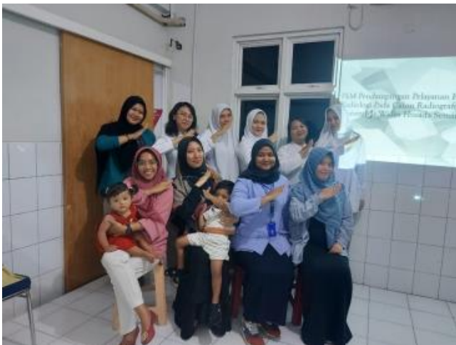
Gambar 4 Peserta Kegiatan Pengabdian Kepada Masyarakat