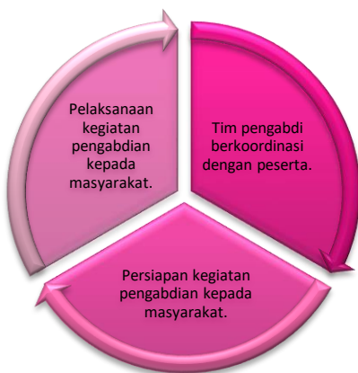
Gambar 1 Bagan Alir Kegiatan Pengabdian Kepada Masyarakat

Berikut merupakan bagan alir dari kegiatan pengabdian kepada masyarakat yang dilakukan: