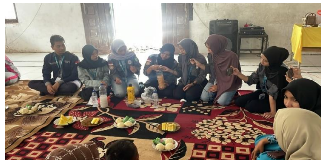
Gambar 1. Kegiatan sosialisasi dan praktik pembuatan pupuk organik cair (POC) berbahan limbah rumah tangga bersama masyarakat Kampung Langsung Permai oleh mahasiswa KUKERTA Universitas Riau.

Pembuatan pupuk organik cair (POC) dari sampah organik rumah tangga khususnya sisa air cucian beras yang dihasilkan setiap harinya dilakukan di kampung Langsung Permai, Kecamatan Bungaraya, Kabupaten Siak dilatar belakangi karena belum adanya pengelolaan limbah rumah tangga sehingga masyarakat membakar atau membuang sampah rumah tangga pada tempat pembuangan sementara. Sampah yang kurang dikelola dan dibiarkan saja dapat menjadi persoalan sehingga dampak negatif bagi kesehatan dan mengganggu kebersihan daerah tersebut. Oleh karena itu, masyarakat perlu diberikan wawasan untuk meningkatkan pengetahuan dan keterampilan mereka terkait pengolahan POC. Kegiatan ini diikuti oleh 18 orang peserta yang merupakan ibu-ibu warga kampung Langsung Permai. Penyampaian materi tentang pengolahan sampah organik menjadi POC diberikan melalui sosialisasi, diskusi dan praktik langsung yang dilakukan oleh mahasiswa.