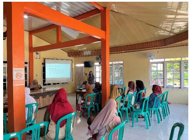
Gambar 2. Dokumentasi Kegiatan Pengabdian Kepada Masyarakat Berupa Sosialisasi Kesehatan

Hal ini sejalan dengan hasil kegiatan pengabdian kepada masyarakat yang telah dilakukan oleh beberapa tim pengabdian yang menyatakan terdapat peningkatan pengetahuan peserta terhadap SADANIS/ pemeriksaan payudara klinis dengan menggunakan modalitas mammography yang digunakan untuk mendiagnosa penyakit kanker payudara dengan persentase sebesar 97% dan adanya peningkatan pengetahuan terhadap pemeriksaan mammography untuk screening dan diagnosa kanker payudara dengan persentase sebesar 91% sesudah pemberian edukasi (Utami et al., 2024; Utami & Alfiani, 2024).