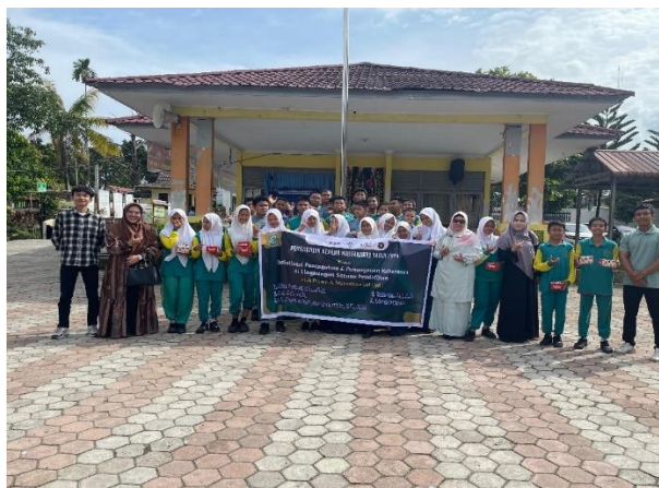
Gambar 3. Foto Bersama setelah kegiatan selesai dengan Siswa-siswi SMP Negeri 13 Pekanbaru.