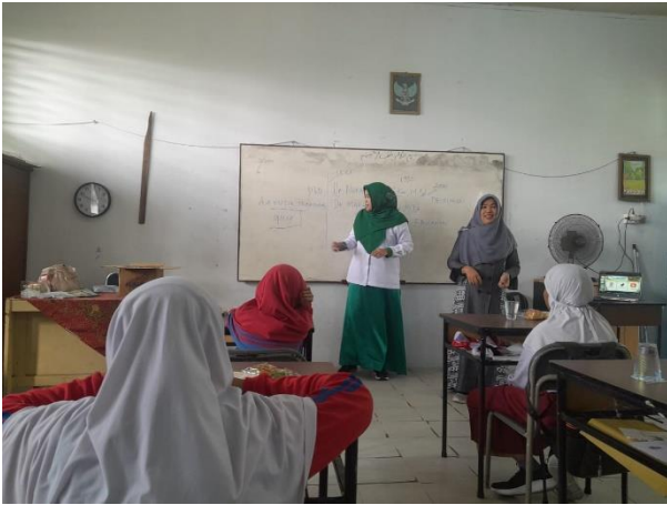
Gambar 2. Penyampaian materi

Solusi dari permasalahan tersebut di antaranya ialah dengan pengembangan kurikulum, yang interaktif dan terintegrasi, pelatihan intensif untuk guru dan siswa, serta penggunaan media sosial sebagai platform pembelajaran dan promosi.