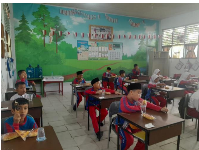
Gambar 1. Siswa mendengarkan materi

Salah satu permasalahan utama yang dihadapi adalah bagaimana mengintegrasikan pembelajaran budaya lokal dengan pengembangan keterampilan bahasa Inggris dan literasi digital siswa. Pembelajaran Bahasa Inggris untuk siswa Sekolah Dasar (SD) perlu dirancang secara matang agar pelaksanaannya dapat berlangsung secara optimal (Nurhajati D 2020). Banyak sekolah yang belum memiliki program atau kurikulum khusus yang menggabungkan ketiga aspek ini secara terpadu. Akibatnya, meskipun siswa mungkin belajar tentang budaya lokal dan bahasa Inggris secara terpisah, mereka tidak memiliki kesempatan untuk mengaplikasikan pengetahuan tersebut dalam konteks yang relevan dan menarik.