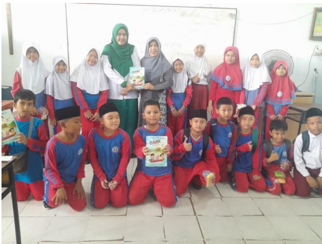
Gambar 3. Siswa yang sudah mendapatkan materi

literasi digital. Pelatihan ini harus mencakup bagaimana mengintegrasikan ketiga elemen ini dalam pengajaran sehari-hari dan bagaimana menggunakan teknologi sebagai alat bantu yang efektif. Selain pelatihan untuk guru, siswa juga perlu diberikan pelatihan intensif yang fokus pada pengembangan keterampilan praktis. Pelatihan ini bisa dilakukan melalui workshop atau kelas khusus yang mengajarkan teknik-teknik kreatif dalam memproduksi konten budaya, seperti pembuatan video, penulisan naskah dalam bahasa Inggris, dan penggunaan aplikasi media social secara efektif. Siswa akan diajarkan cara-cara membuat konten yang menarik dan informatif tentang budaya Melayu Riau, serta cara mempublikasikan konten tersebut di platform media sosial dengan cara yang aman dan bertanggung jawab.